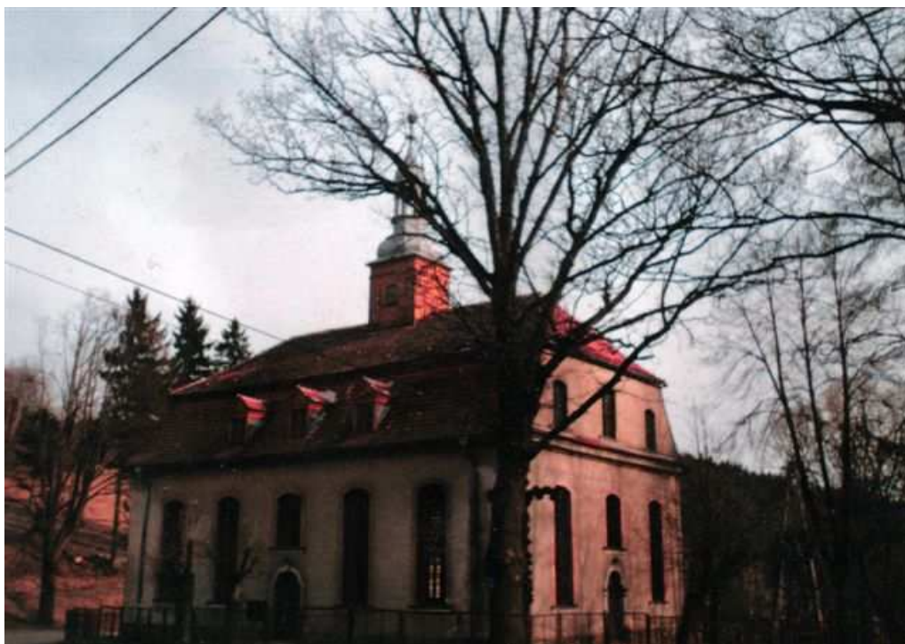
Fot. Kościół filialny pod wezwaniem św. Józefa