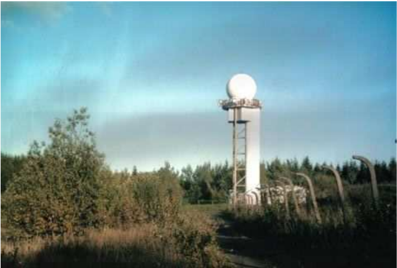
Fot. Radar meteorologiczny