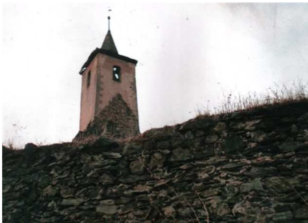
Fot. Ruiny kościoła katolickiego

2. Kościół katolicki /ruina pozostała wieża/ (obiekt wnioskowany o ujęcie w rejestrze zabytków ) murowana z XIII, XV/XVI w.,