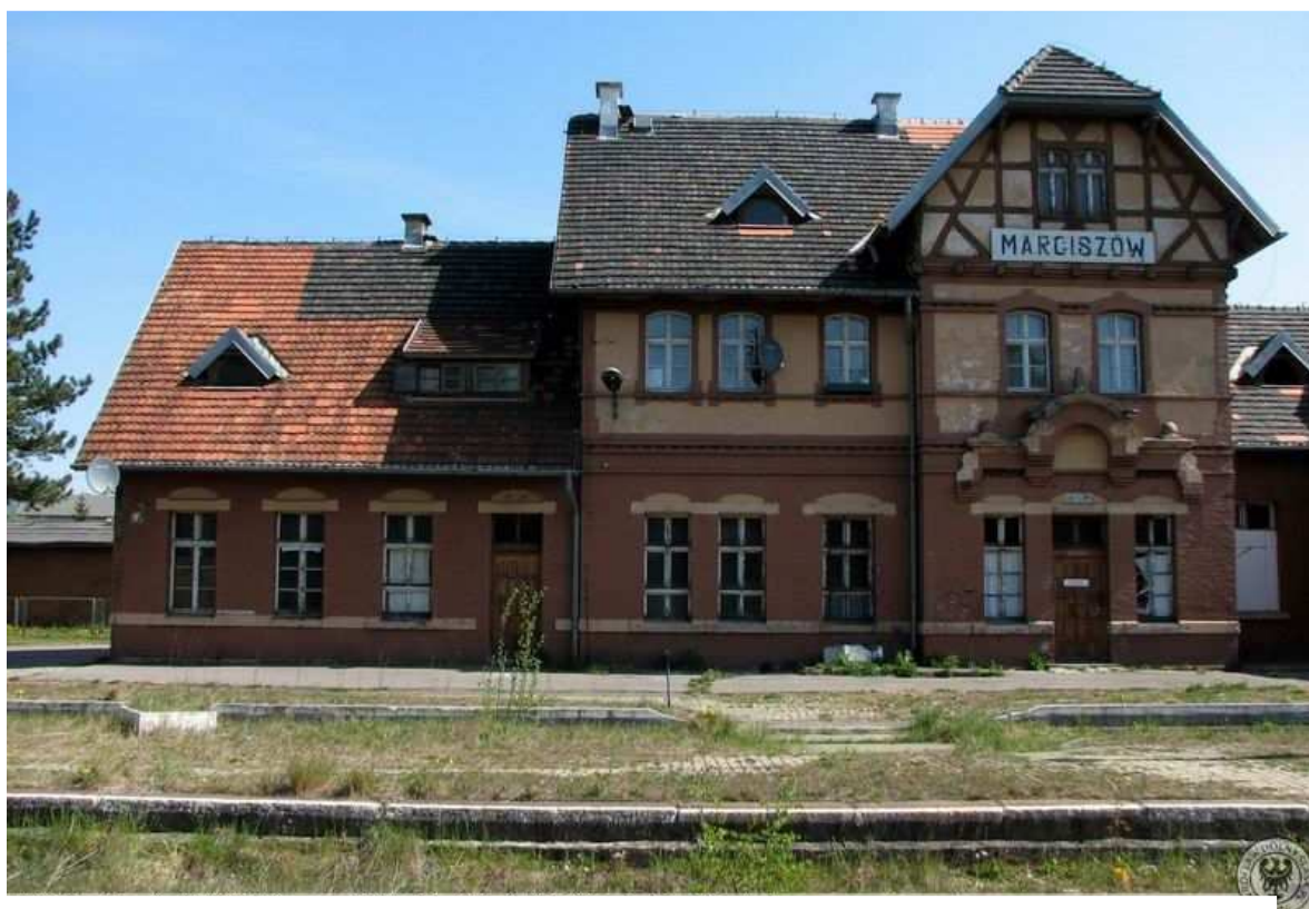
Marciszów - Dworzec od strony peronów