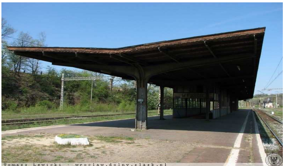
Tomasz Lewicki - wroclaw.dolny.slask.pl Marciszów - Dworzec, peron 3. największy z wiatą stalową