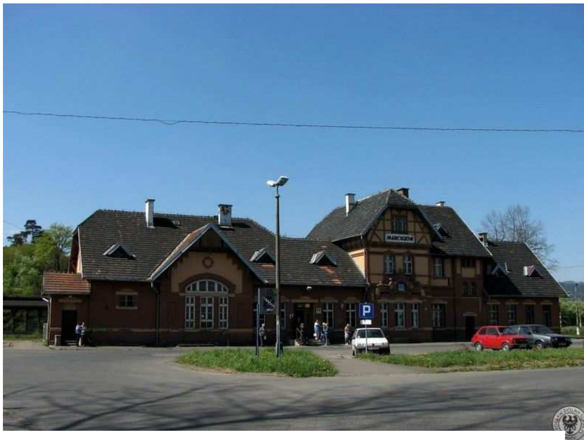
Marciszów - Dworzec, front budynku z placem