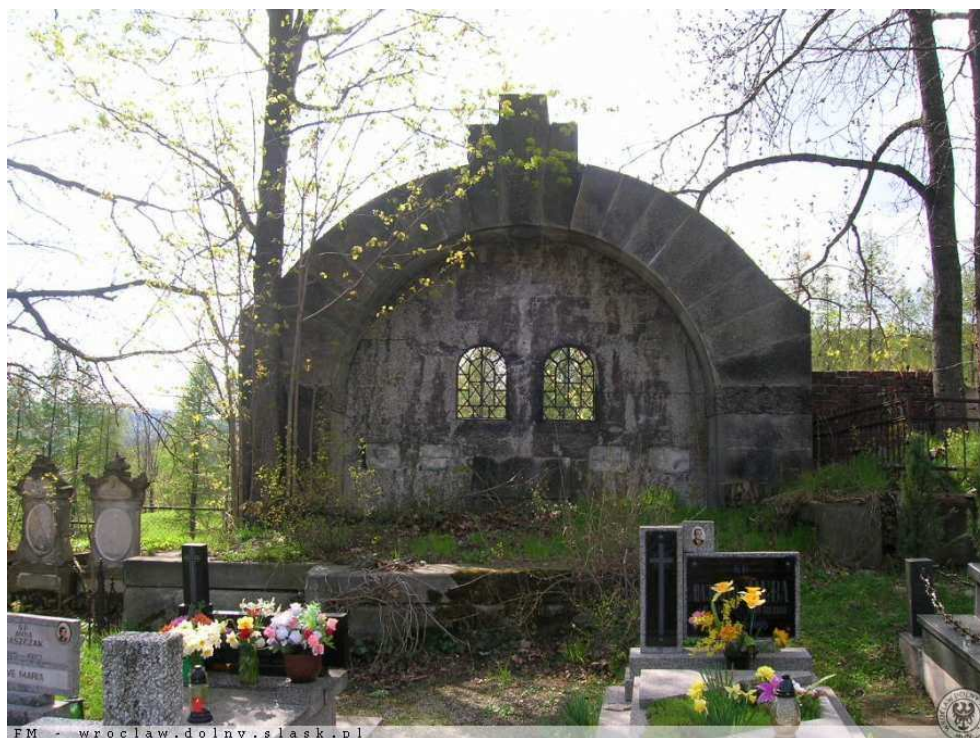
Monumentalny przedwojenny grobowiec na cmentarzu parafialnym w Marciszowie.