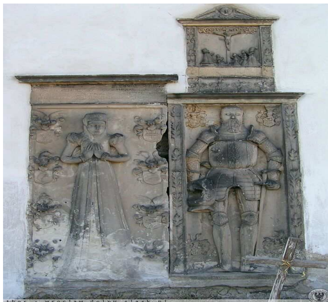
Marciszów - pochodzące z XVI w. płyty nagrobne członków rodu von Zedlitz na ścianie zewnętrznej kościoła św. Katarzyny