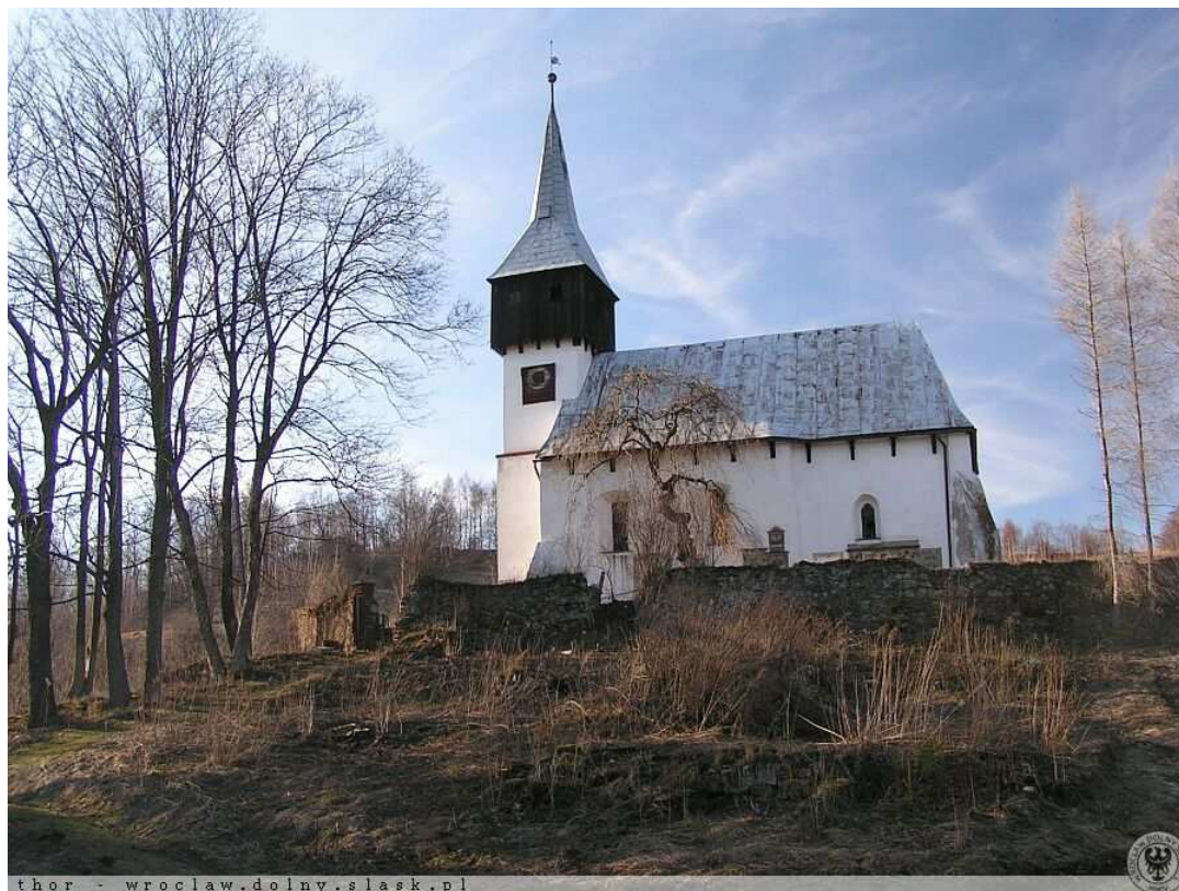
Marciszów - kościół św. Katarzyny