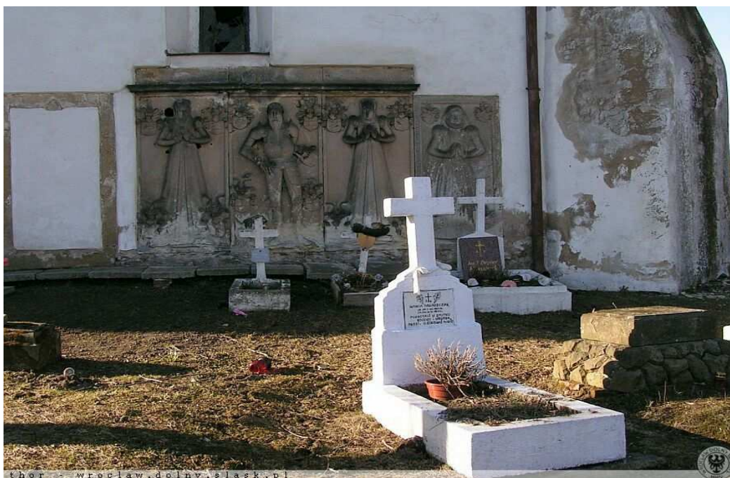
Marciszów - fragment cmentarza i ściany kościoła św. Katarzyny wraz z zespołem płyt nagrobnych członków rodu von Zedlitz.