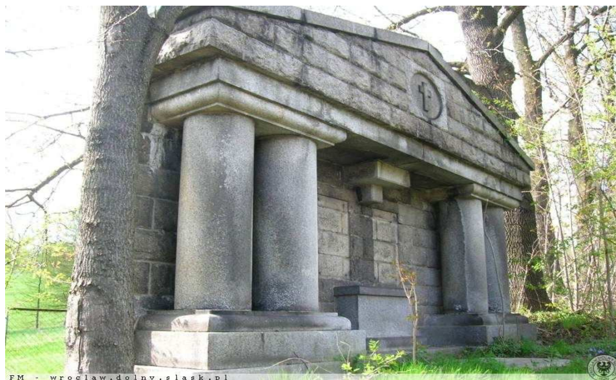
Monumentalny przedwojenny grobowiec na cmentarzu parafialnym w Marciszowie.