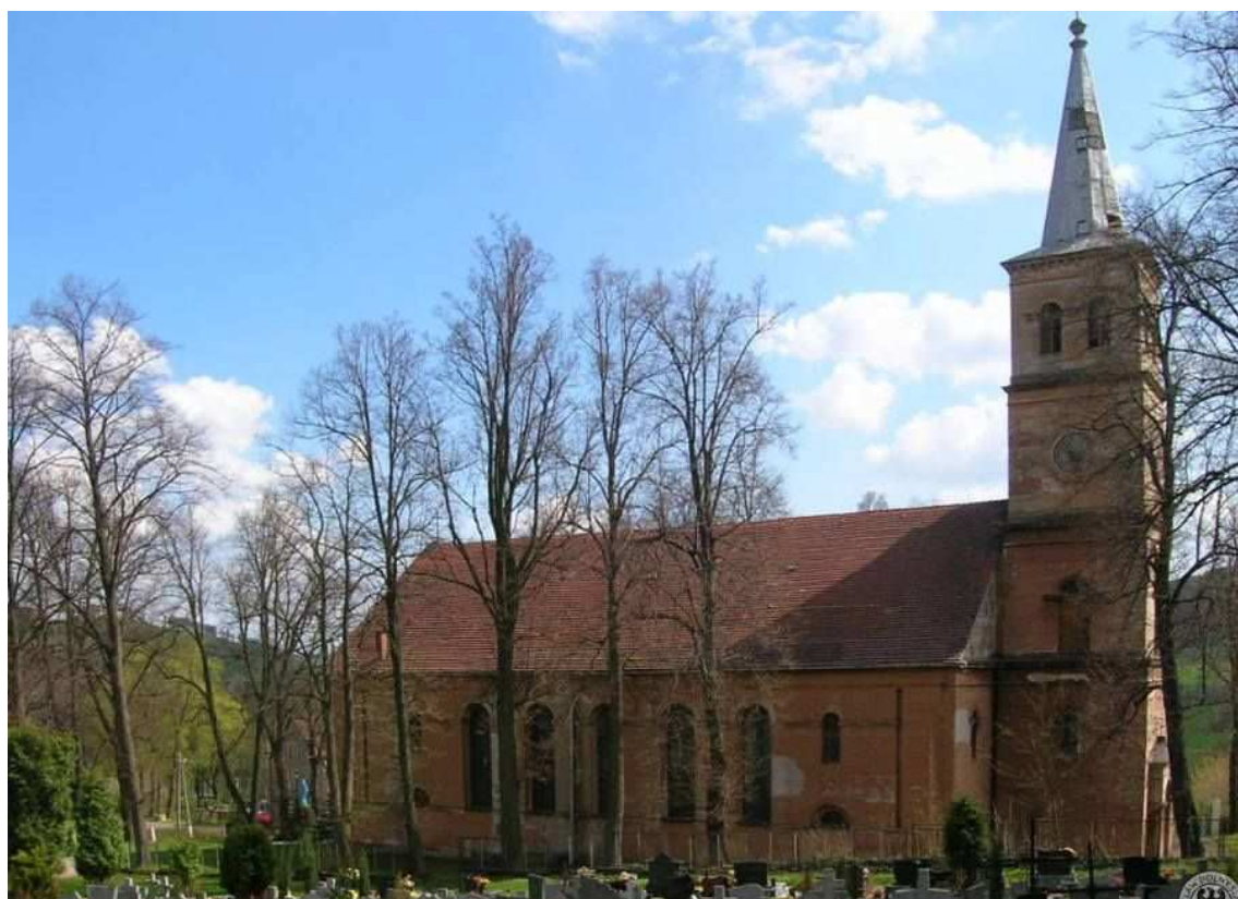
Kościół Niepokalanego Serca NMP w Marciszowie, widok z cmentarza parafialnego.