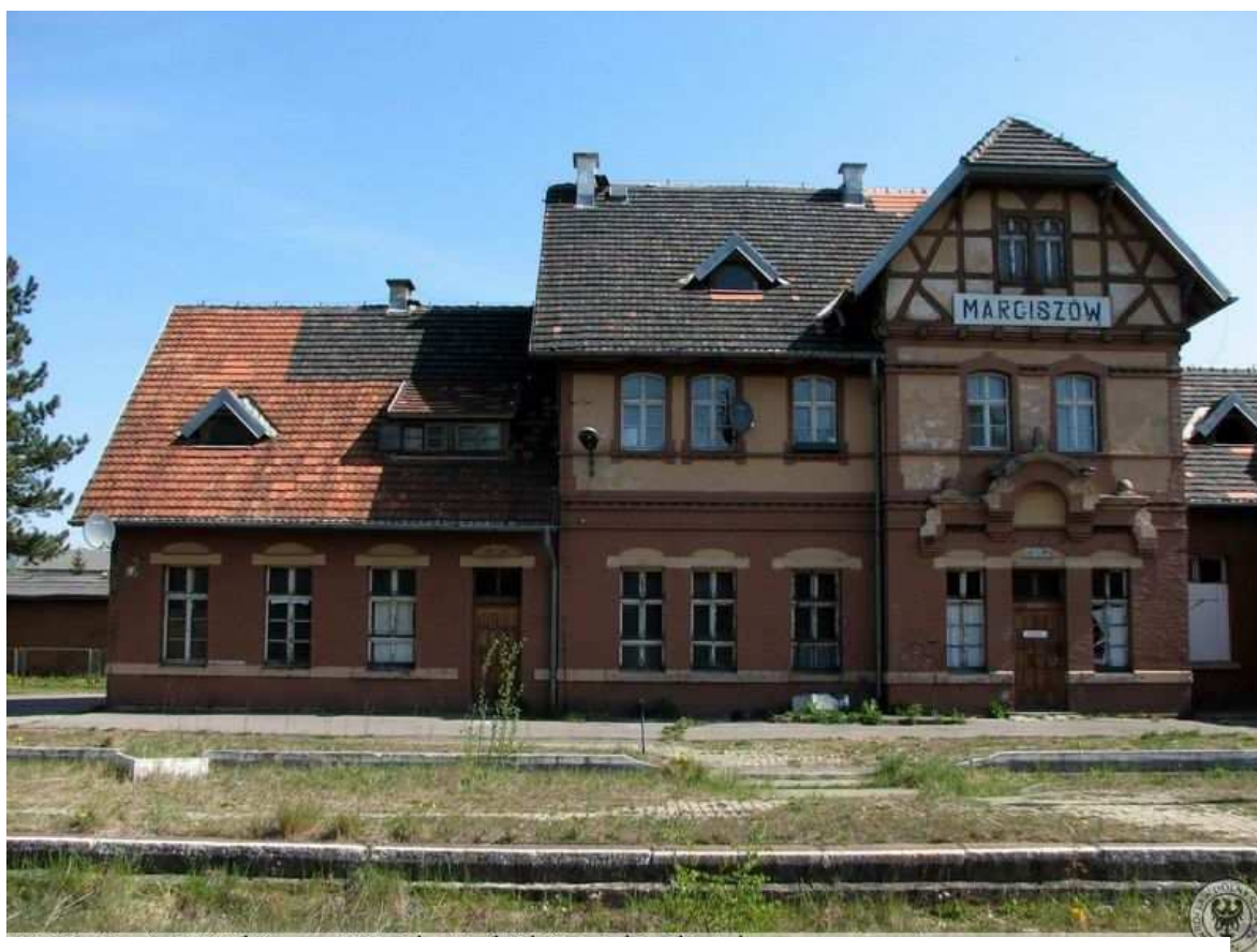
Marciszów - Dworzec od strony peronów