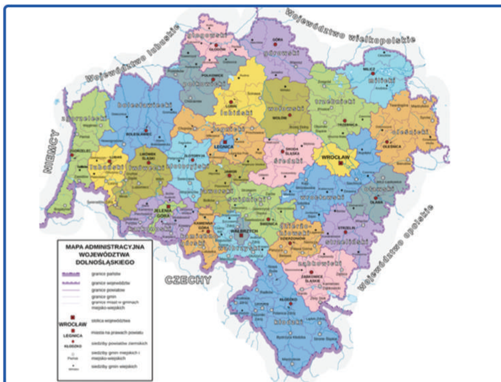
Mapa 1 Podział administracyjny województwa dolnośląskiego

Główną drogą biegnącą przez Gminę jest Droga Krajowa nr 5 prowadząca do granicy z Republiką Czeską. Jest to jedna z głównych dróg krajowych biegnąca przez województwa: kujawsko-pomorskie, wielkopolskie i dolnośląskie. Komunikację drogową w kierunku zachodnim zapewnia droga wojewódzka nr 328 Marciszów – Nowe Miasteczko.